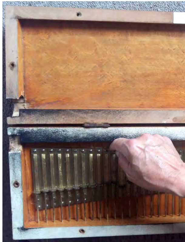
Geöffnete Windlade der Physharmonika. Die an ihrem unteren Ende festgeschraubten, frei schwingenden Zungen werden durch die verschiebbaren Stimmkrücken von beiden Seiten fixiert. Mit dem nach unten aus der Lade führenden Draht werden die Krücken verschoben, was die Tonhöhe verändert.