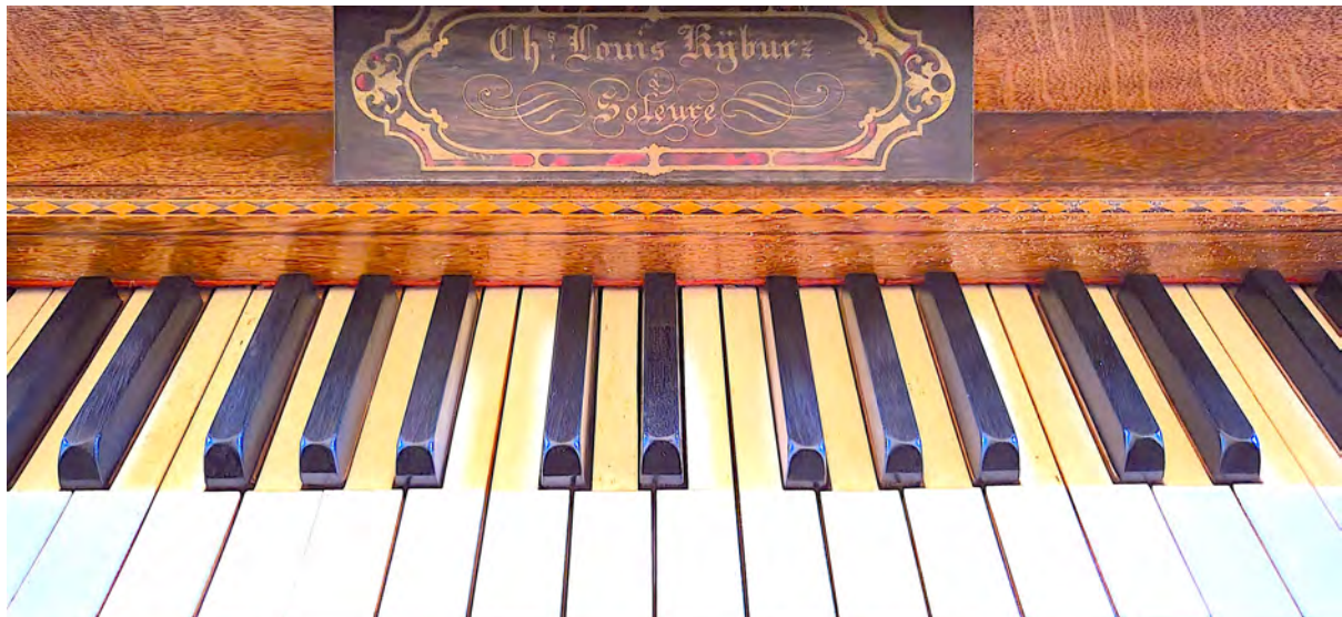
Mittlere zwei Oktaven der Manualtastatur und Firmenschild: «Ch. s Louis Kyburz à Soleure»