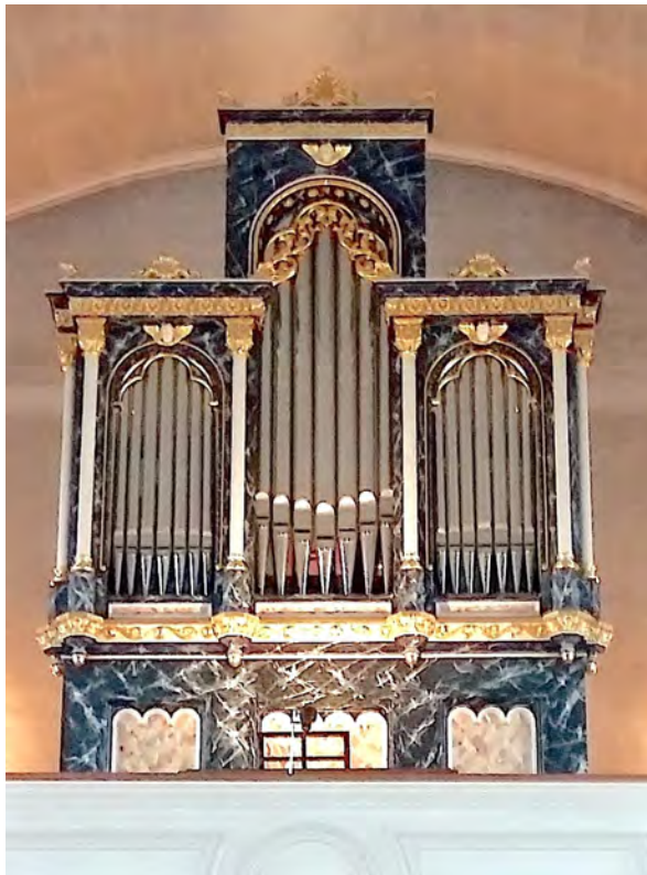
Der Orgelspropekt heute

Die Orgel der Klosterkirche Visitation in Solothurn wurde 1864 vom Solothurner Orgelbauer Louis Kyburz (1828–1906) erbaut. Sie ist heute das einzige Werk von Kyburz, das noch weitgehend original erhalten und an seinem ursprünglichen Standort geblieben ist. Als eine der ältesten Kegelladenorgel der Schweiz überhaupt und dank ihrer historischen, gut funktionierenden «Physharmonika» (durchschlagendes Zungenregister) hat sie für die Schweizer Orgellandschaft eine besondere Bedeutung. Im Jahre 2022 wurde die Kyburz-Orgel durch die Firma Metzler aus Dietikon (ZH) umfassend restauriert. Dieselbe Firma hatte das Instrument schon in den Jahren zuvor gewartet und gepflegt. Für die Überholung der Physharmonika wurde der Harmonium- und Orgelbauer Daniel Bulloz aus Villars-le-Comte (VD) beigezogen. Am 6. November 2022 wurde die Orgel von Generalvikar Dr. Markus Thürig eingeseget, Domorganist Benjamin Guélat spielte das Einweihungskonzert.